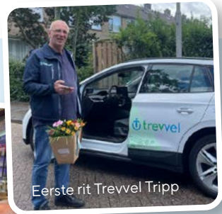
Eerste rit Trevvel Tripp