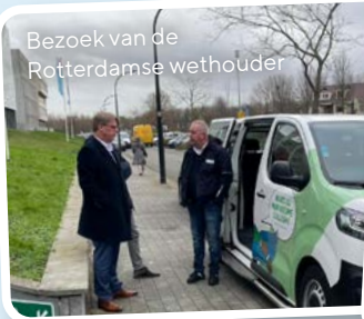
Bezoek van de Rotterdamse wethouder