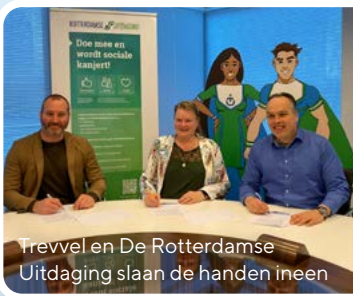
Trevvel en De Rotterdamse Uitdaging slaan de handen ineen