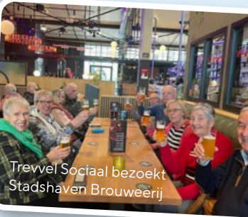
Trevvel Sociaal bezoekt Stadshaven Brouwerij