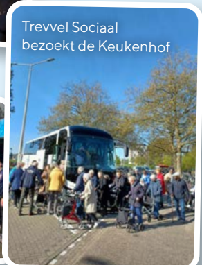
Trevvel Sociaal bezoekt de Keukenhof