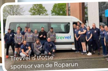
Trevvel is trotse sponsor van de Roparun